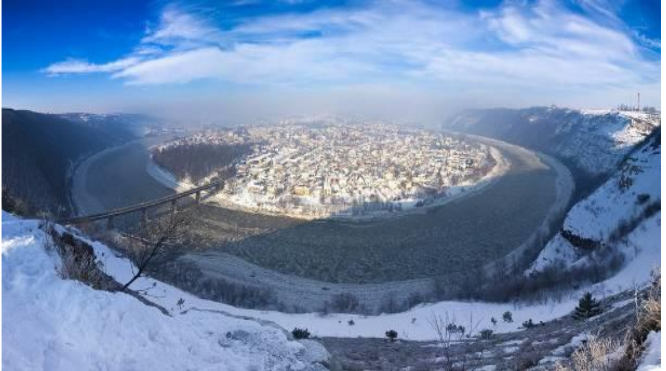
мал. 2.3. Річка Дністер місто Заліщики

Річка Нічлава відноситься до малих річок, є водним об'єктом господарсько-побутового призначення. Стік ріки (у верхній течії Нічлавка) формується на території області. Забруднення спостерігається по всій течії річки. На якість вод особливо впливають зворотні води міста Борщів, де відсутні очисні споруди. Завдяки каскаду ставків на території міста, де відбувається самоочищення води, вплив міста зменшується. В нижній течії річка має високий вміст сульфатів, чим суттєво відрізняється від інших рік регіону.