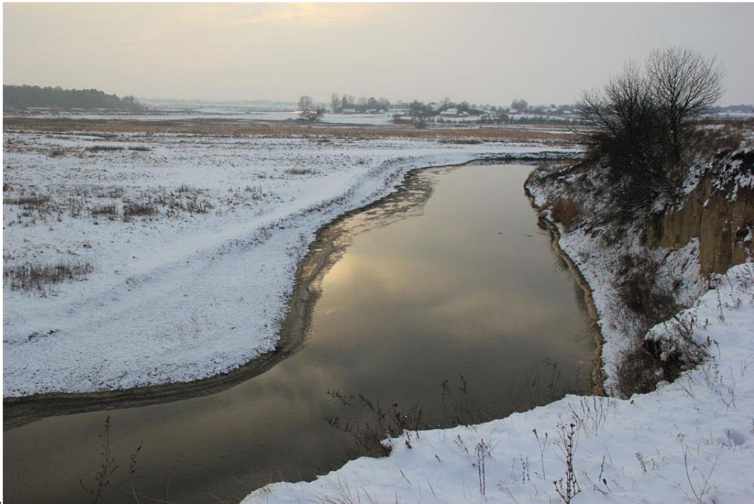
Мал. 2.6. Річка Іква