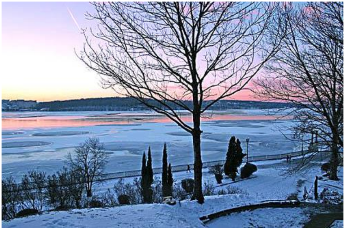
Мал. 2.1. Тернопільський став

Контроль за станом р. Серет Тернопільського водосховища проводився 13 лютого 2019 року регіональним офісом водних ресурсів у Тернопільській області від створу, який знаходиться в м.Тернопіль 180 км (Тернопільське водосховище).