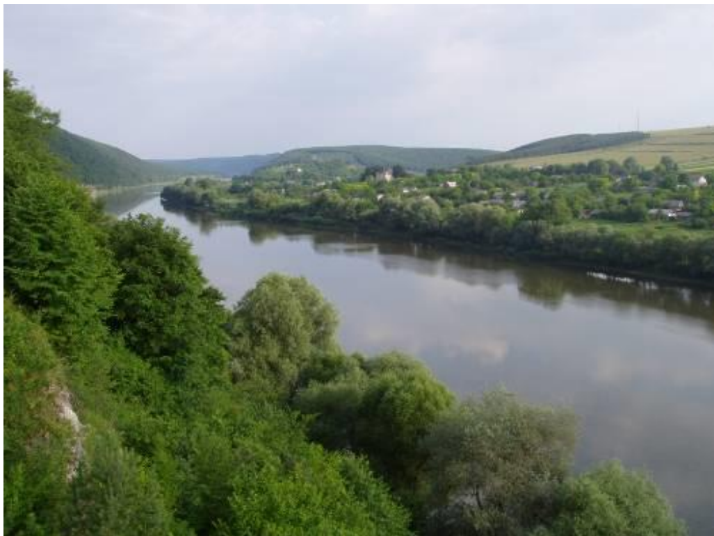
Мал. 2.2. Касперівське водосховище на річці Серет

Контроль за станом р. Серет в районі Касперівського водосховища протягом лютого не проводився.